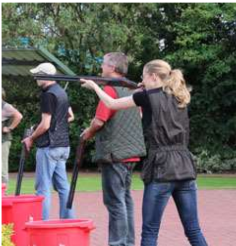
Tontaube Trap 15 Stück mind. 5 Treffer (30 Schuss; Doppelschuss erlaubt)