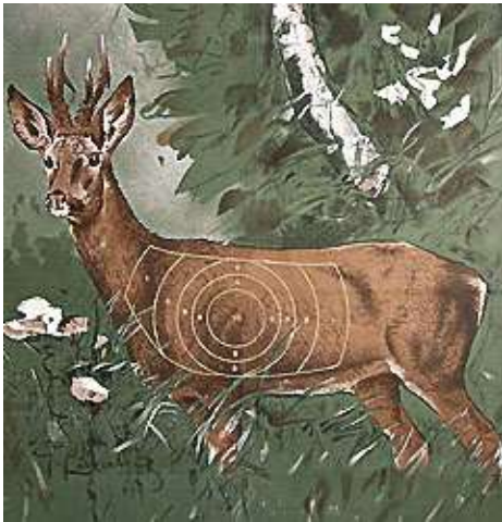
Rehbockscheibe 100 m stehend angestrichen mind. 25 Ringe (5 Schuss)