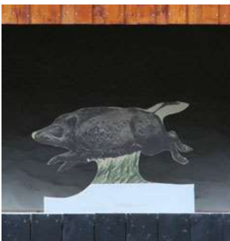
laufender Keiler 50/60 m 5 Stück mind. 2 Wertungstreffer (5 Schuss)